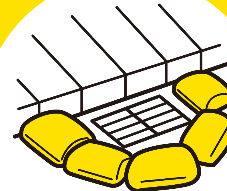
流水防止 水路誘導

1個あたり幅 (W) 25cmで計算してください。 1段積みで水位7.5cm、2段積みで水位15cmに対応できます。 ※イメージは7個を2段で設置した場合です。