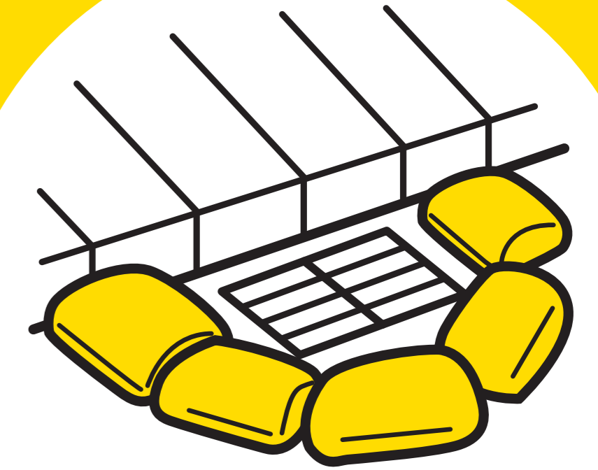
流水防止 水路誘導

1個あたり幅 (W) 25cmで計算してください。 1段積みで水位7.5cm、2段積みで水位15cmに対応できます。 ※イメージは7個を2段で設置した場合です。